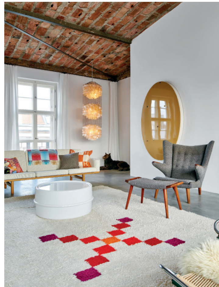
En otra sala de estar contigua al espacio común, butaca Papa Bear y sofá Model de Hans J. Wegner, mesa Ilumesa con luz y alfombra, ambas de Verner Panton y, en la pared, obra de Thomas Grünfeld. Dcha., en el dormitorio infantil, cómoda Mickey de Pierre Colleu de los 80 y obra de Cindy Workman.