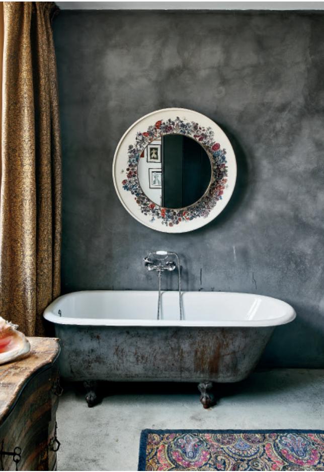
En el baño principal, bañera de derribo y espejo de Fornasetti. Dcha., otra imagen del comedor con una lámpara de Panton al fondo y escultura Misfit de Thomas Grünfeld. Debajo, en el parque infantil de la azotea, arenero de Paul Hosking, caballito de Tomi Ungerer y columpio y tobogán de Gabriel Rico. A la izda., en el office, mesa de Jean Prouvé, sillas Pretzel de Norman Cherner y negra de Panton, obra de espejo de Paul Hosking y, a la dcha., escultura de Frank Stella.