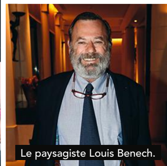
Le paysagiste Louis Benech.